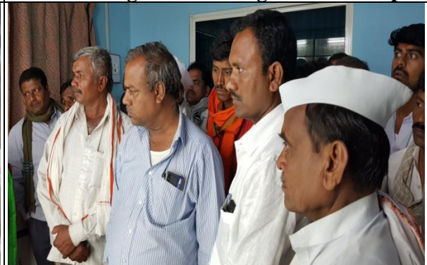
Farmers are Keenly Taking Information