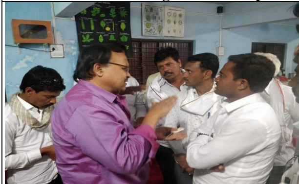
Farmers and Faculty Interaction Session