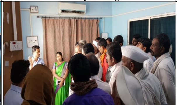
Lectures delivered by Dr. Bhosale S.B.