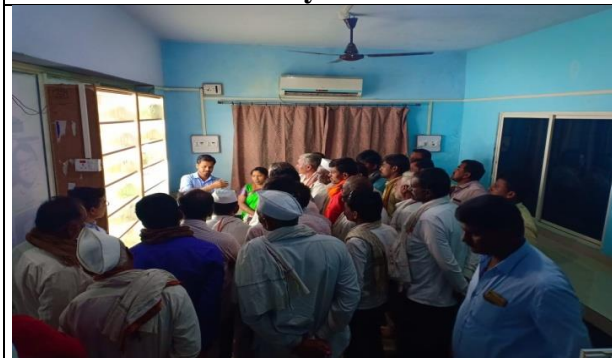
Visit at Tissue Culture Lab by Farmers